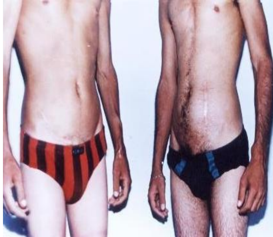
Fig. 3. Cicatrices de ambos trasplantes renal