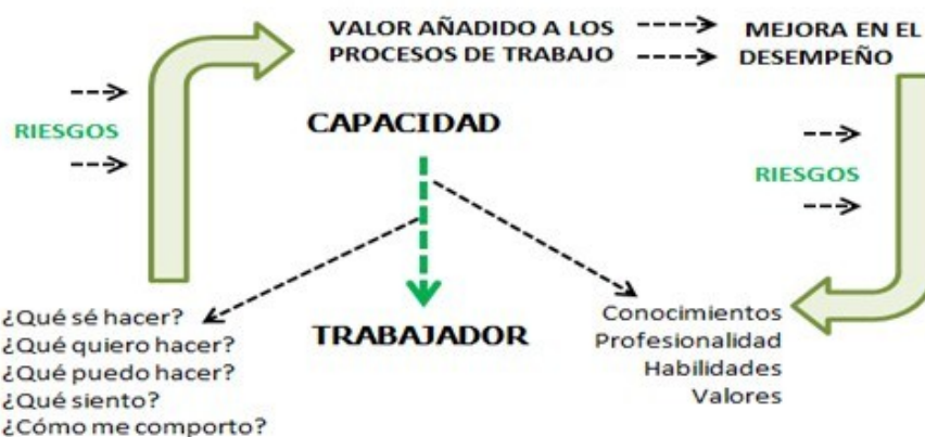
Figura 3. Esquema de la aproximación conceptual de la gestión por competencias en armonía con los riesgos (esquema del autor).

El estudio muestra que los términos recursos humanos y resultados juegan un papel fundamental en la conceptualización de gestión por competencias, que provienen de la base del concepto de competencia laboral el cual tiene una configuración psicológica, por lo que la implementación de la gestión por competencias puede estar presente cierta vulnerabilidad en el cumplimiento de sus objetivos. Al evaluarse estos elementos y las acotaciones recogidas en la Tabla 3, que revelan la competencia en un sentido sintético y coherente, se propone un nuevo concepto del término gestión por competencias, en el cual introduce los elementos que pueden hacer vulnerable a esta gestión y pueden poner en riesgo su despliegue (Figura 3).