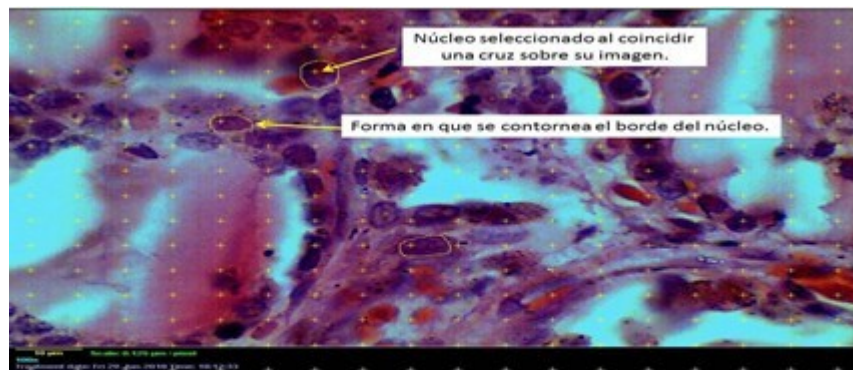
Figura 1. Imagen a 2125x de carcinoma papilar de tiroides. Tinción hematoxilina y eosina.

digital un conjunto de herramientas, como un cuadrulado o una malla de cruces y medir solo aquellos núcleos sobre los que coinciden las cruces de la malla. Con esta selección aleatoria las mediciones se realizaron a un total de 10 465 núcleos. El área entre los puntos fue de 50 micrómetros cuadrados (Figura 1).