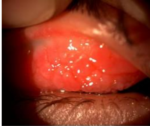
Fig 1. Papilas gigantes de ojo derecho