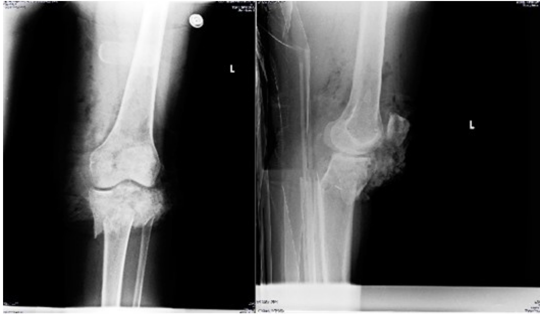
Figura 1. Solución de continuidad del tejido óseo a nivel de la zona metafiso-epifisaria de la tibia proximal izquierda.

Una vez en la sala de Ortopedia se prescribió curas en días alternos y se realizó radiografía de control nuevamente en vistas antero-posterior y lateral (CS-0013359/18) (Figura 4).