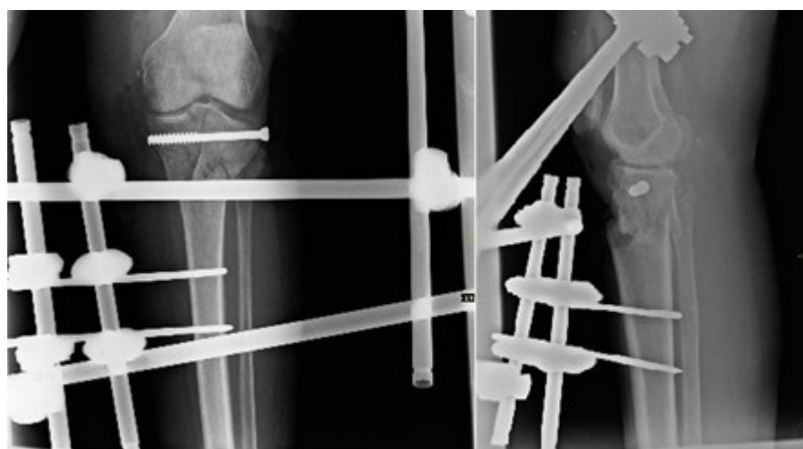
Figura 4. Control radiográfico posoperatorio de la fractura.

La paciente necesitó de injerto de piel, su situación de salud evolucionó de forma satisfactoria y la FE fue retirada a los tres meses y medio cuando se confirmó la presencia de signos de consolidación radiográficos.