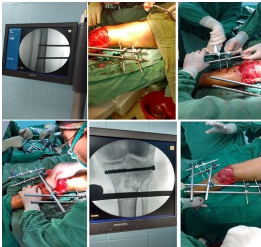
Figura 3. Colocación de fijación externa tipo Hoffman 1® con dos anclajes en fémur y tibia.