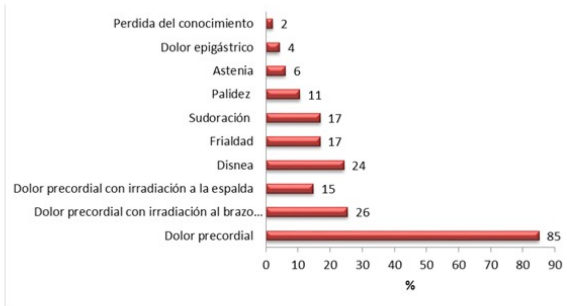
Gráfico 2. Síntomas y signos más frecuentes en pacientes femeninas con infarto agudo de miocardio.