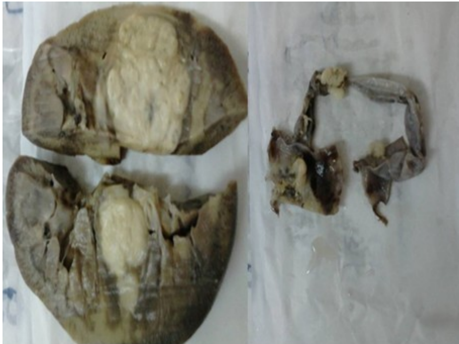
Figura 3. Estudio macroscópico de riñón derecho.

Se administró penicilina por vía endovenosa durante cuatro semanas y luego por vía oral durante seis semanas. Se observó una respuesta clínica favorable con resolución de las lesiones hepáticas y de la pared abdominal.