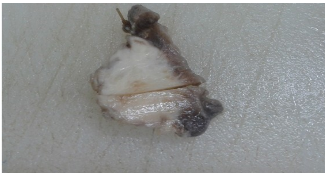
Figura 1. Imagen macroscópica de la lesión luego de corte transversal, donde se observa lesión tumoral de 3cm x 2cm x 2cm, de color blanquecino, no encapsulada, de contornos irregulares, mal delimitada del tejido tiroideo.

Los gránulos del citoplasma fueron positivos para ácido periódico de Schiff. El diagnóstico anatomopatológico definitivo fue: tumor de células granulares benigno intratiroideo. La resección quirúrgica fue el tratamiento utilizado y un año después no se ha producido recidiva.