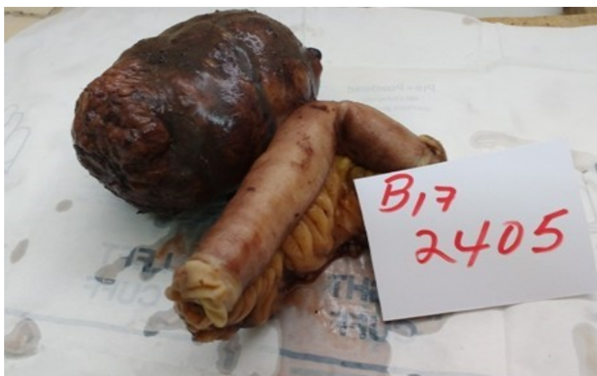
Figura 1. Aspecto macroscópico del tumor extirpado pediculado, ovalado y color pardo oscuro, con número de biopsia B17 2405

En la tomografía axial contrastada se observó presencia de imagen heterogénea, hipodensa de 24 UH de 10x34 cm en la excavación pelviana derecha. Se discute en colectivo, cirujanos y gastroenterólogos, y con diagnóstico de tumor de colon, se decide laparotomía exploratoria, en el acto quirúrgico se encuentra en las últimas asas de yeyuno tumoración de 10 cm, con crecimiento exofítico, se realiza resección intestinal de alrededor de 12 cm y enterorrafia termino terminal, no adenopatías abdominales, ni metástasis hepática. Se realizó amplia toilette de la cavidad peritoneal y el cierre habitual. Se envió la muestra al departamento de Anatomía Patológica (figura 1 y 2).