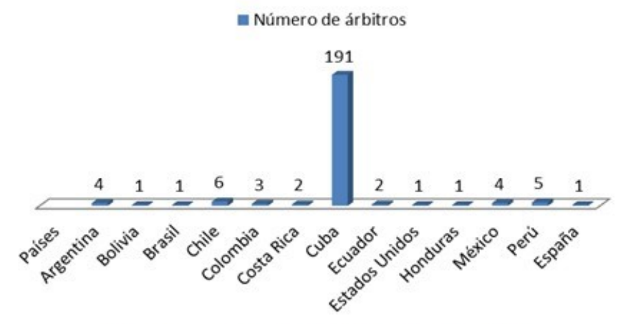
Gráfico 2. Distribución de árbitros por países