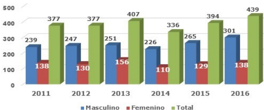
Gráfico 3. Mortalidad por Cáncer Pulmonar en Camagüey. 2011-2016.

Fuente: anuario estadístico de salud 2016