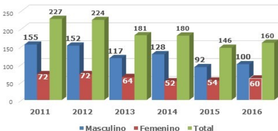
Gráfico 2. Morbilidad por Cáncer Pulmonar en Camagüey. 2011-2016.

Fuente: anuario estadístico de salud 2016