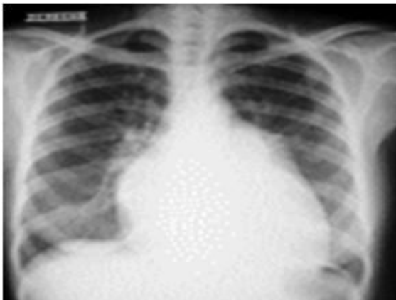
Figura 1. Telecardiograma, se visualiza crecimiento de cavidades derecha, con prominencia del tronco de la arteria pulmonar y plétora sanguínea

Las alteraciones clásicas que se detectan en un telecardiograma son: cardiomegalia por agrandamiento de la AD y el VD, dilatación de las arterias pulmonares centrales con plétora pulmonar, lo que indica un mayor flujo pulmonar. En ocasiones se visualiza una vena cava superior dilatada en su segmento proximal, obligando al médico de asistencia a descartar una CIA tipo seno venoso cava superior. 28 (Figura 1)