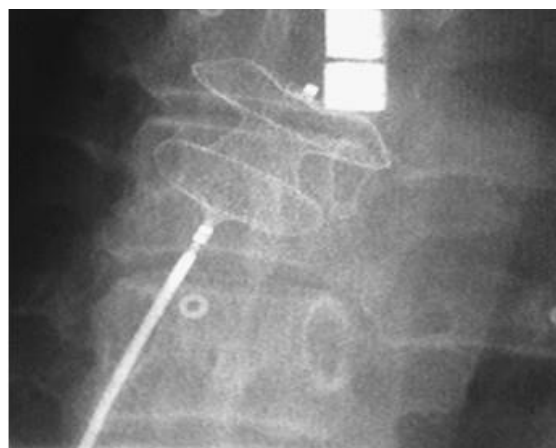
Figura 3. Cierre de una CIA OS por vía percutánea, inserción de un dispositivo Amplatzer septal occluder bajo visión fluoroscópica

La inserción del dispositivo se realiza bajo visión fluoroscópica o con la guía de un ETE (Figura 3)