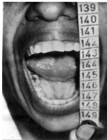
Fig. 2: Apertura bucal preoperatoria.

Los resultados se evaluaron de excelentes cuando no se reportaron nuevas luxaciones y se mantuvo la apertura bucal postoperatoria. No se reportaron pacientes de regular ni de malo