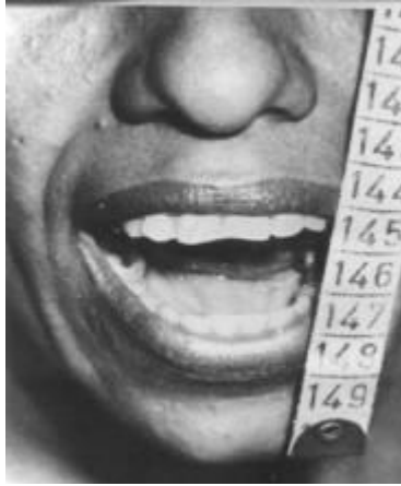
Fig. 3. Postoperatorio inmediato.