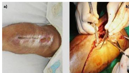
Figura 1. Defecto óseo en el tercio superior de la tibia y vía de abordaje para obtener el colgajo fasciomuscular

Paciente masculino, de piel blanca de 38 años de edad, con antecedentes de haber sufrido una fractura abierta del tercio superior de la tibia tipo II de Gustilo-Anderson; de urgencia se le colocó un fijador externo modelo RALCA, y posteriormente se le realizó osteosíntesis con el sistema AO (láminas y tornillos). Después de dos años de evolución, el paciente comenzó a presentar supuración mantenida a través de la lesión, se retiró el material de osteosíntesis y se confirmó el diagnóstico de Osteomielitis Crónica por medio del cultivo de secreciones con la presencia de estafilococos aureus, y por la biopsia que mostró infiltrado de células inflamatorias crónicas del tipo de los linfocitos y macrófagos con áreas de necrosis. Se estableció un plan de tratamiento quirúrgico basado fundamentalmente en el uso de curetajes óseos y secuestrectomías, como secuela quedó un defecto óseo de 6cm en la cara anterointerna de la tibia. (Figura 1a)