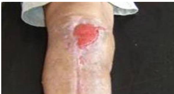
Figura 5. Presencia de un tejido de cicatrización óptimo para recibir el injerto de piel

El defecto creado en el sitio donante se cerró por planos y se pudo cubrir con técnicas de deslizamiento de piel, sin necesidad de realizar injerto dermoepidérmico. 4-6