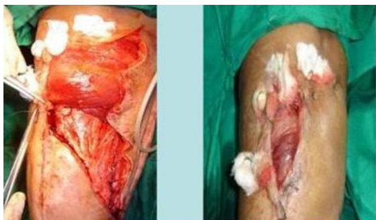
Figura 4. Uso de drenaje aspirativo y puntos de piel con torundas de gasas

Después de haber realizado tres cultivos seriados, sin crecimiento bacteriano, se procedió a cubrir el defecto con colgajo muscular regional, específicamente del gastrocnemio medial. El paciente se evaluó definitivamente a los 30 días, donde hubo total cobertura del defecto y la presencia de buen tejido de granulación, quedando todo listo para el injerto de piel. (Figura 5)