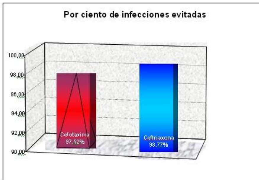
Gráfico 1. Efectividad en por ciento de infecciones evitadas

El por ciento de infecciones evitadas fue de 98.77 (245/3) con el uso de la Ceftriaxona y de 97,52 (364/9) con el de la Cefotaxima. Gráfico 1.