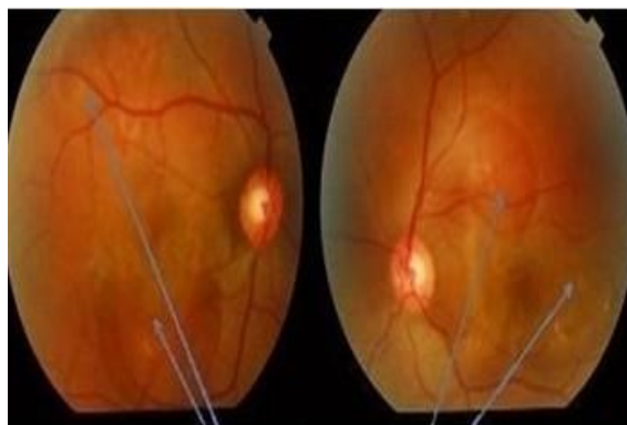
Figura 1. Desprendimiento seroso de la retina

desprendimientos de retina que rebasaban las arcadas temporales, no se detectó desgarros retinianos, aunque si una posible membrana epiretinal en ambos ojos. (Figura 1)