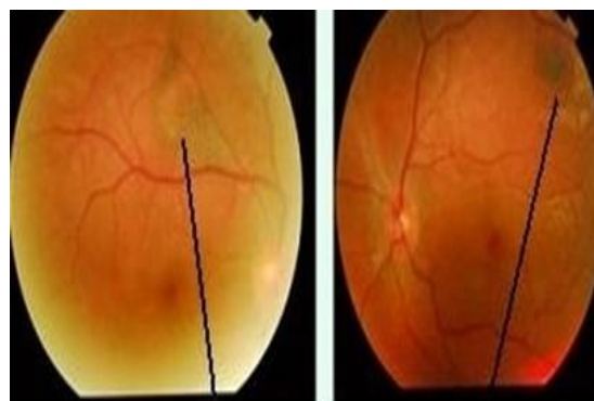
Figura 2. Dispersión de pigmentos

Al mes de comenzado el tratamiento, el paciente presentó AV de 0.8 en OD y 0.7 en OI, retina completamente aplicada, aunque se observó la presencia de dispersión de pigmento en el epitelio pigmentario y persistencia de la membrana epirretinal en AO. No hubo signos uveales. (Figura 2 y 3)