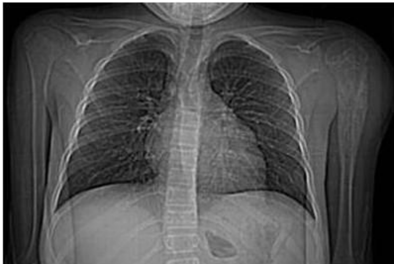
Figura 2. Topograma de TAC de tórax que muestra la lesión metafisiaria en el húmero izquierdo con irradiación a diáfisis

Huesos largos: la matriz tumoral es siempre osteolítica y produce un patrón moteado infiltrativo permeativo. En el comienzo del cuadro predomina la esclerosis cortical, en las localizaciones diafisarias, y a medida que el tumor progresa se combina con lesiones líticas erosivas de la cortical. Una vez que perfora y rebasa la cortical eleva el periostio y determina la aparición de una reacción periosteal en espículas, en capas de cebolla e incluso en forma de triángulo de Codman. A veces la reacción perióstica es similar a la que se observa en los osteosarcomas. Cuando perfora el periostio se extiende a las partes blandas cuya afectación se mide bien mediante la tomografía axial computarizada (TAC). ( Figura 2 )