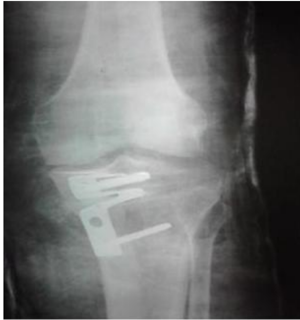
Figura 2. Vista anteroposterior

lámina AO, se decidió el cierre por planos de la herida quirúrgica. Al terminar el cierre de la piel se aplicó apósito estéril y se colocó inmovilización enyesada tipo calza. Posteriormente se realizó radiografía en vistas anteroposterior y lateral. ( Figura 2 y 3 )