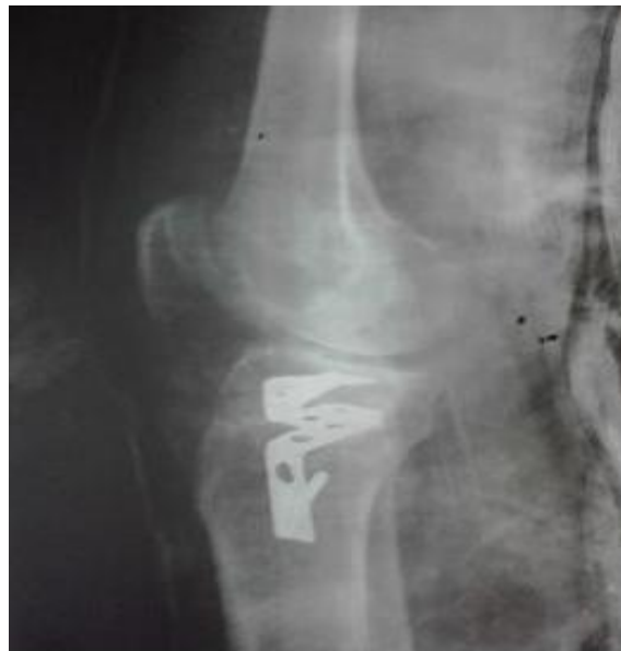
Figura 3. Vista lateral