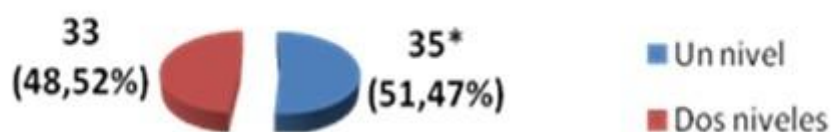
Gráfico 3. Pacientes según número de niveles vertebrales operados

Con respecto a los 65 pacientes (95,58 %) no ocurrieron complicaciones, valor que no difirió estadísticamente con el grupo control. Se observó la ocurrencia de