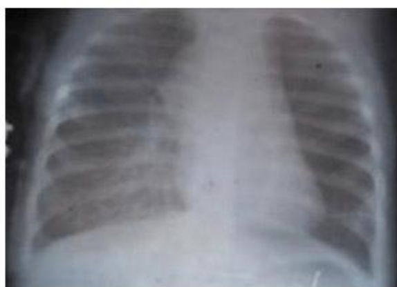
Fig. 1. Radiografía simple de tórax donde se observa opacidad redondeada en la región parahiliar derecha, de densidad homogénea.

En un nuevo Rayos X de tórax se observó el pulmón izquierdo hiperaereado y velamiento de la base pulmonar derecha. Teniendo en cuenta el antecedente de procesos inflamatorios repetidos, la presencia de estridor y la historia aportada por la madre de ingestión de alimentos sólidos, se plantea la posibilidad de un cuerpo extraño en vías aéreas, por lo que se consideró la realización de broncoscopia, pero al revalorarse en colectivo los estudios radiológicos de tórax, se visualizó una imagen redondeada central, presente en todas las radiografías desde que la enferma era una lactante pequeña Fig.1.