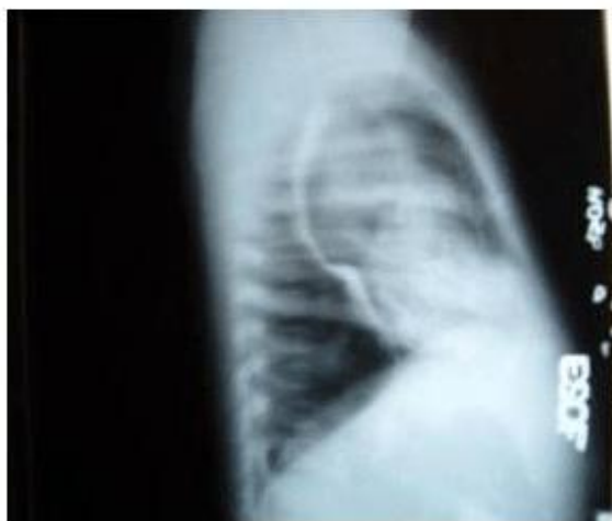
Fig. 2. Vista lateral del esofagograma. Se visualiza imagen redondeada de mediastino posterior que desplaza la tráquea hacia delante y esófago comprimido y rechazado posteriormente.

Se discute con el colectivo de Cirugía, y teniendo en cuenta los datos clínicos de la paciente y las imágenes de la radiografía simple de tórax, el esofagograma, el ultrasonido y la tomografía axial, se plantea la presencia de una masa mediastinal posterior que desplaza la tráquea hacia delante y el esófago posteriormente, de naturaleza quística, y la posibilidad diagnóstica de quiste broncogénico. Fig. 2.